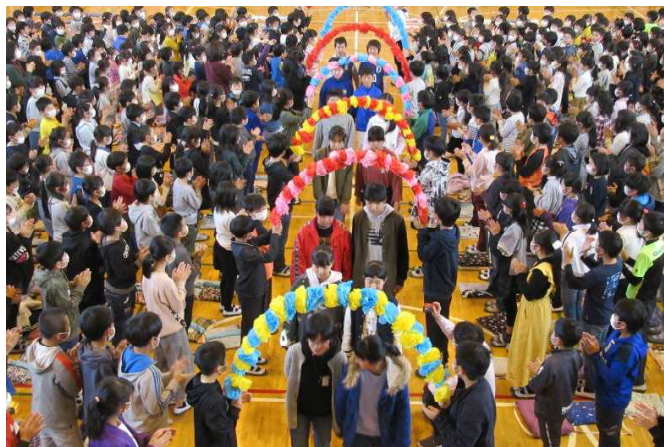
花のアーチをくぐって退場する6年生

6年生は改めて卒業を意識するとともに、玉諸小での楽しい思い出が、またひとつ増えたことと思います。