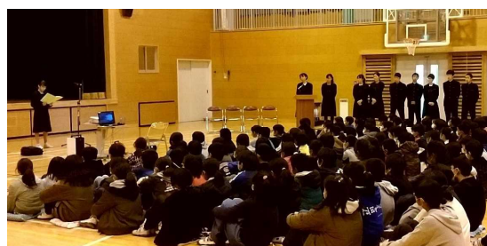
東中生による説明の様子

また、東中学校では、昨年6月にオープンスクールも行われ、多くの6年生が参加しています。このような行事を通して、中学進学への緊張感や不安が軽減され、「中1ギャップ」などなく、スムーズな中学校進学につながると思います。