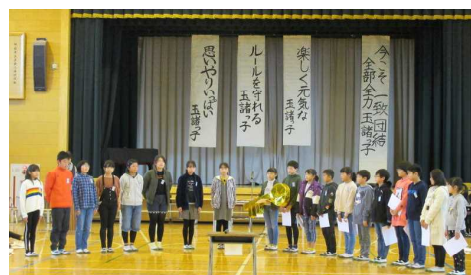
新本部役員への引継ぎ式

現本部役員から新本部役員への引継ぎ式が行われました。新本部のメンバーの引き締まった表情から、来年度の児童会活動への意気込みが感じられました。