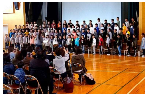
4年生の授業参観「二分の一成人式」

一日一日の成長は小さなものでも、それを一年間積み重ねることで、子どもたちは大きく成長します。そのもとになる「毎日、安心して登校し、落ち着いた学校生活を送ること」ができたのは、温かい家庭があるからこそです。子どもたちの健やかな成長のために、今後も学校と家庭とで手を携えて教育活動を進めていきたいと思ひます。